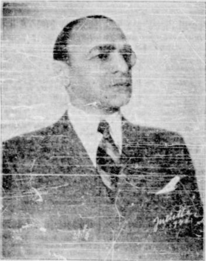
D. Armand Călinescu, ministrul Interneilor, a rostit în seara de Miercuri 11 Ianuarie 1939, la ora 20.30, în cadrul „Orei Națiunii“, următoarea cuvântare, despre Rostul Frontului Renașterii Naționale.

Cuvântarea d-lui ministru Armand Călinescu rostită la radio în cadrul „Orei Națiunii“