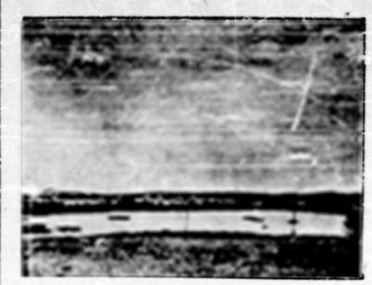
Dunărea în Tulcea